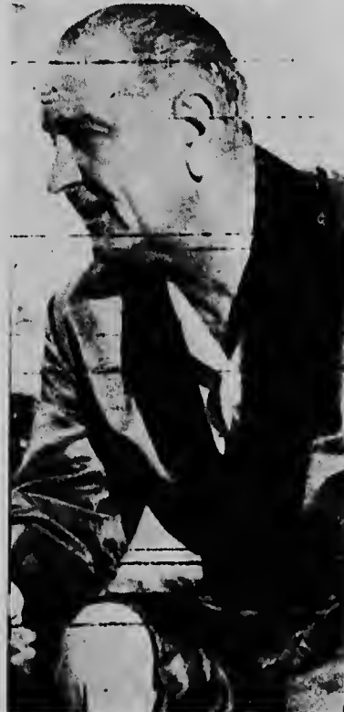
Lyndon B. Johnson

YAKARTA --UPI-- E studiantenan indones a exigí awe pa cu Congreso reuni "lo mas pronto posibel pa kita presidente Sukarno for di su puesto. Un hefe militar a declara cu ejercito ta-